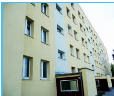
Rydza Śmigłego 32 - 60