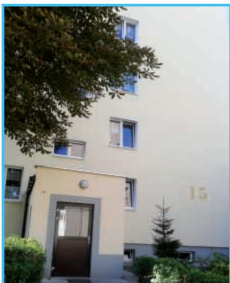
I Maja 15