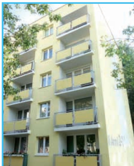
II Armii 2-14