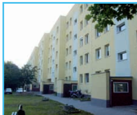
Rydza Śmigłego 32 - 60