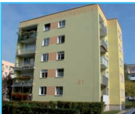
T. Zawadzkiego „Zośki” 87